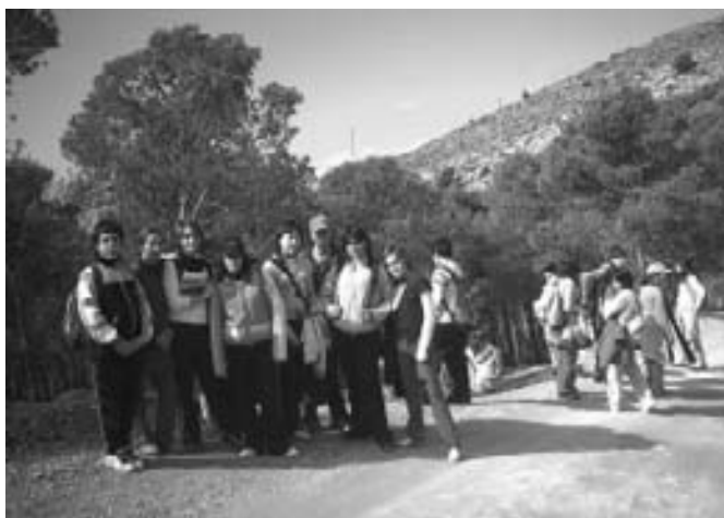
Alumnos y alumnas de 1º y 2º descansan en su excursión a la sierra.

■ Promovidas por el Departamento de Educación Física, todo el alumnado del IES ha podido participar en alguna de las dos excursiones a distintos parajes de la Sierra de Gádor, celebradas los días 1 y 8 de Febrero. El primer día, los chicos y chicas de 1º y 2º subieron Los Borondos hasta llegar a Cortijo Clavero. Siete días más tarde, las alumnas y los alumnos de 3º y 4º realizaban una ruta más larga, por el Cortijo Clavero, Cortijo Blanco y Fuente Vieja.