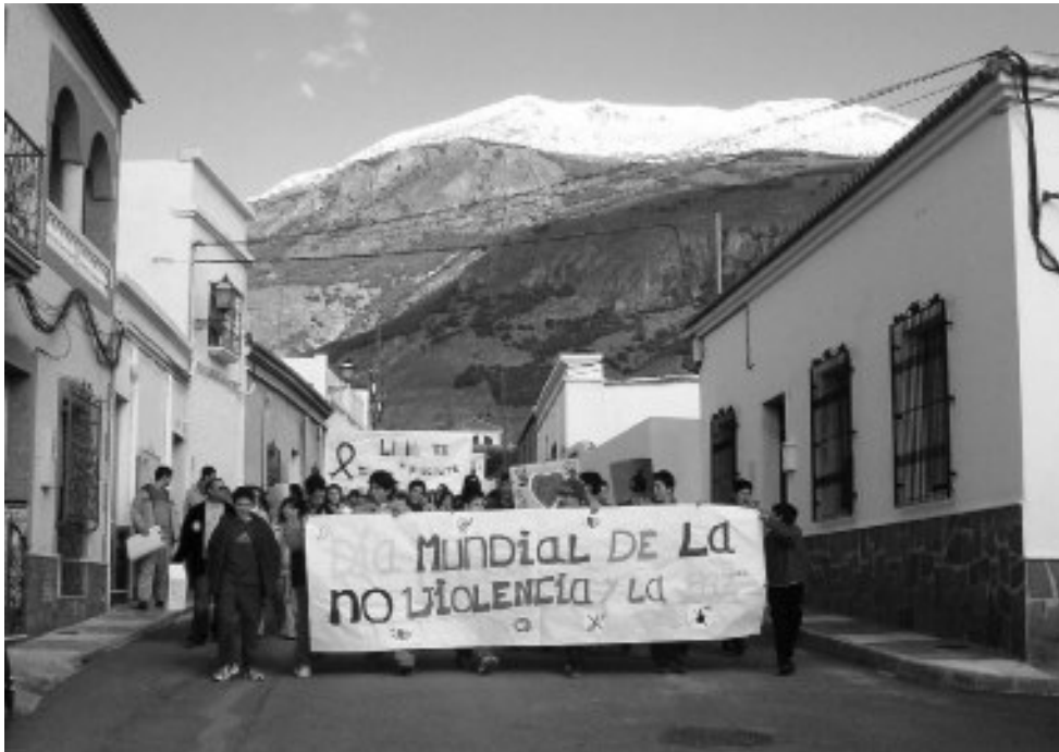
Imagen de la marcha realizada por profesorado y alumnado del IES «Ciudad de Dalías» con motivo del DENIP, el lunes 30 de Enero. Una vez concentrados en la Plaza, desde la Balconada del Ayuntamiento, una alumna leyó un Manifiesto por la Paz y la No Violencia, y se soltaron palomas blancas.

Con motivo de la próxima celebración del Día de Andalucía, el IES daliense ha programado esta Semana Cultural que incluye gran diversidad de actividades, procurando, primeramente, ofrecer a sus alumnos y alumnas alternativas para su tiempo libre y que, a la vez, vayan dirigidas a su formación personal y quizás también profesional. Además de los numerosos talleres que constituyen el programa de estas jornadas, destacar la potenciación de actividades de convivencia, como la reforestación y almuerzo en Fuente Nueva (día 22) o la paela gigante del jueves 23, abierta a todos los sectores de la comunidad educativa. En el desarrollo de esta VIII Semana Cultural colaboran el Ayuntamiento de Dalías, AMPA «Balcón de la Alpujarra» y Asociación «Talia».