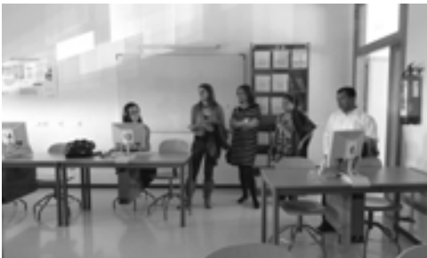
Recorrido por el IES «Ciudad de Dalías». Aula de Informática