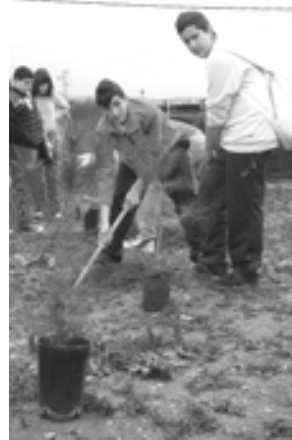
De reforestación en el Curso 2009/2010

Pues... no jugar en todos los recreos al fútbol, no poder utilizar entonces la pista; así como los cuartos de baño con llave, aunque comprendo la medida.