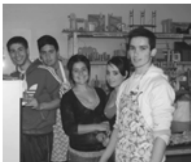
En las Jornadas Culturales de 2012

- ¿Te han ayudado los maestros cuando lo has necesitado?