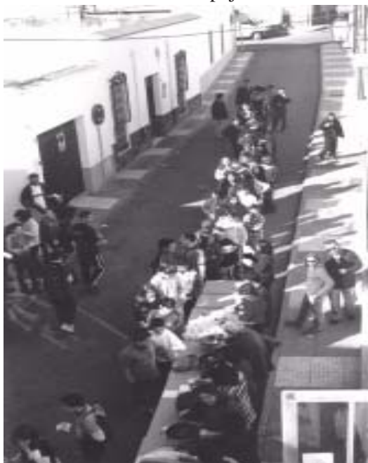
Reparto de chocolate con bollos.